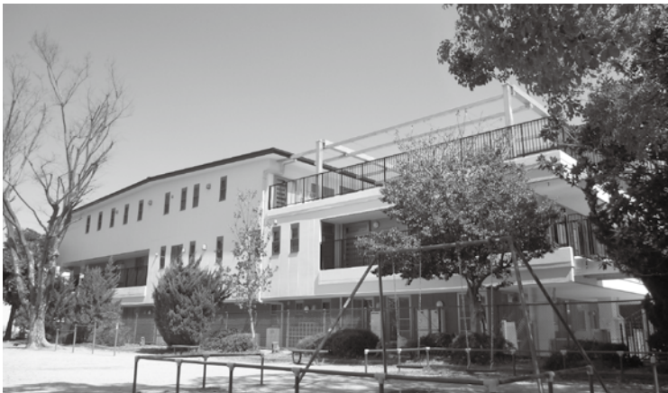
めいほく保育園 新園舎

おひろめ会には、保育園OB、子どもたち、地域の方々、保育関係者など両園とも三〇〇名近くの方にお越しいただきました。