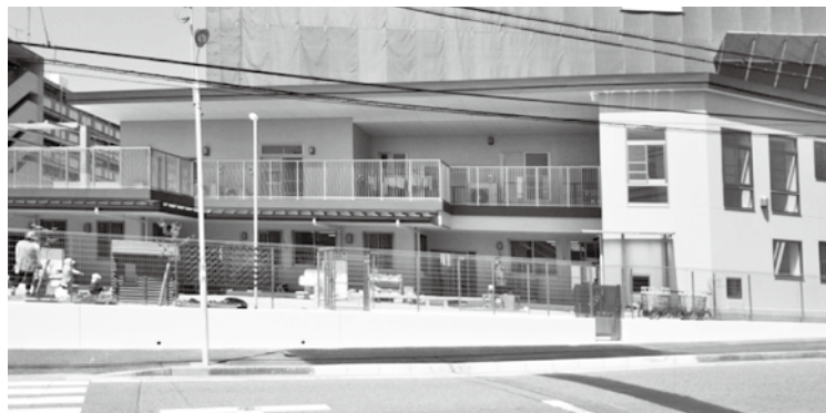
やだ保育園 新園舎