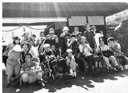
楽しいことが したいです! (安井の家仲間)

分たちで育てたさつまいもで作ったおやつはどんなにも良く食べられていました。毎週木曜日には音楽・スポーツを通じて自己表現をする「りんりんズ・らんらんズ」二グループを編成しました。よさこい踊り・スポーツグッズを使ったレクリエーションでみなさん生き生きと活動されています。今年も仲間たちと