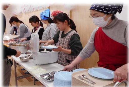
当日の運営を支える、スタッフ。地域ボランティアさん。