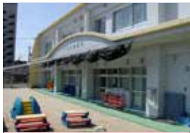
西部医療センターくさのみ保育所