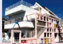
第二めいほく保育園