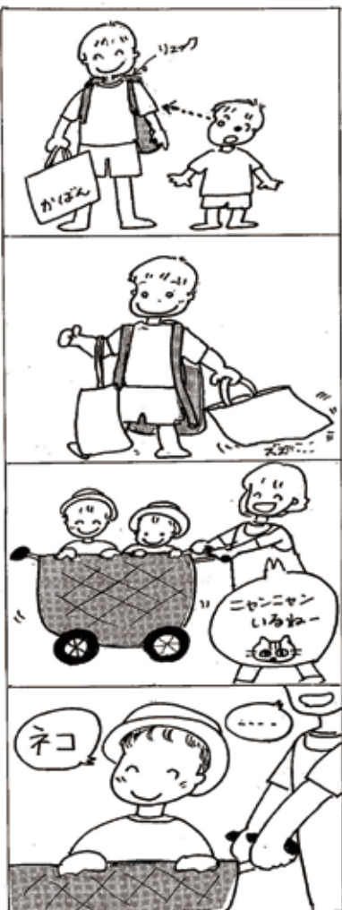
大きいんだもん・1歳児編

研修を受ける側が勉強になるのはもちろんですが、研修を企画する側が一番勉強になることに気づきました。まさに「人育て」は「共育ち」なんだと痛感しています。