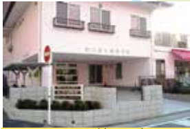
めいほく鳩岡の家 相談支援センターはとおか