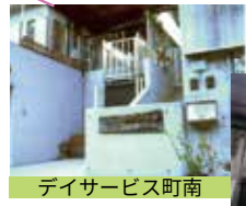
デイサービス町南