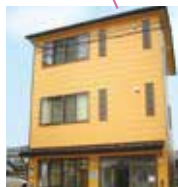
デイサービス東町 ヘルパーステーションそら