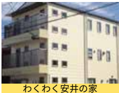
わくわく安井の家