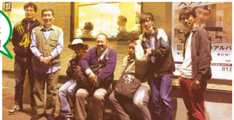
●めいほくホーム●僕たちの街での暮らし②