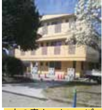
友の家ホームいっぽ