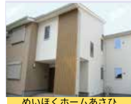
めいほくホームあさひ