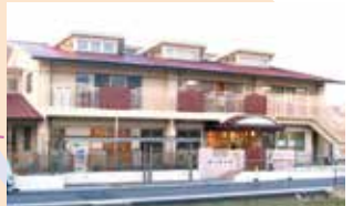
なえしろ保育園 子育て支援センターなえしろ