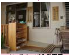
めいほくつぼみ保育室 名北福祉会本部 おたすけらぶ