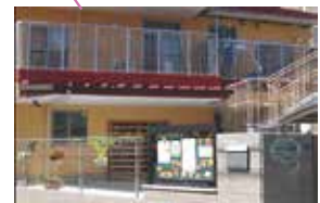
やだ保育園 子育て支援拠点事業やだっこ