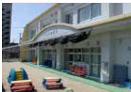
西部医療センターくさのみ保育所