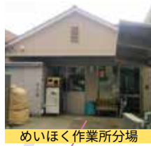
めいほく作業所分場