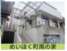
めいほく町南の家