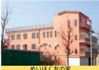
めいほく友の家 相談支援センターくすのき