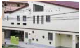
めだか保育園 子育て支援拠点事業めだかひろば