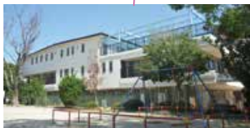
めいほく保育園 子育て支援センターめいほく