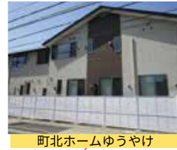
町北ホームゆうやけ