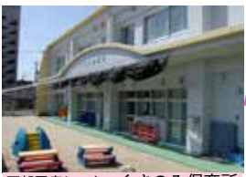
西部医療センターくさのみ保育所