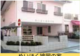
めいほく鳩岡の家