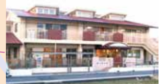
なえしる保育園 子育て支援センターなえしる