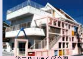
第二めいほく保育園