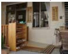
めいほくつぼみ保育室 名北福祉会本部 おたすけらぶ