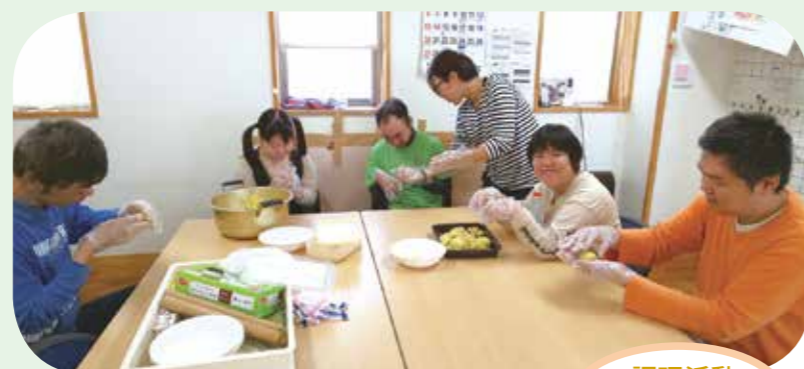
調理活動 芋団子づくり