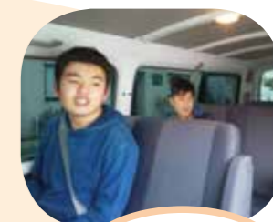
お家にかえるねえ～