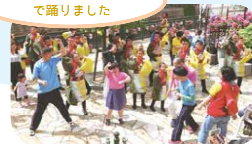
堀川フラワーフェスティバルで踊りました