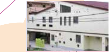
めだか保育園 子育て支援拠点事業めだかひろば