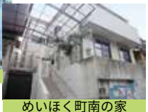
めいほく町南の家