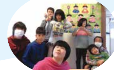
ひなまつりパーティー