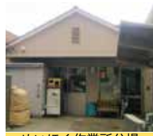
めいほく作業所分場