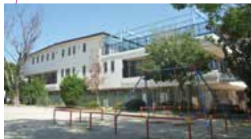
めいほく保育園 子育て支援センターめいほく