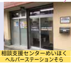
相談支援センターめいほく ヘルパーステーションそら