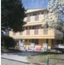
友の家ホームいっぽ