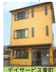
デイサービス東町