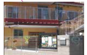
やだ保育園 子育て支援拠点事業やだっこ