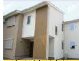
めいほくホームあさひ