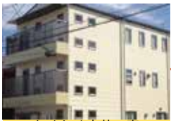
わくわく安井の家