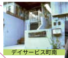
デイサービス町南