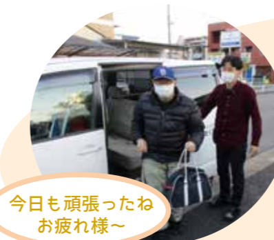
今日も頑張ったね お疲れ様～