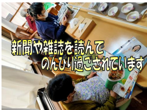
新聞や雑誌を読んでのんびり過ごされています