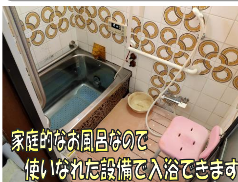
家庭的なお風呂なので使いなれた設備で入浴できます

デイサービスに着いたら、まずはお茶をのんでいただくところから1日が始まります。10時から体操、レクリエーションに参加していただき、順番にお風呂に入ってもらいます。浴室は決して広いとは言えませんが、できるだけご自身のお力が入っていたできるように手すり、すのこ、すべり止め等を設置しています。できる所はご自身で行なってもらい、できない所を少しだけお手伝いさせていただきます。体操・レクリエーションは、歓談をまじえながら楽しんで参加してもらえるように心がけています。