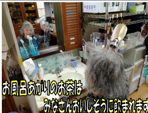
お風呂あがりのお茶はみなさんいしように飲まれます