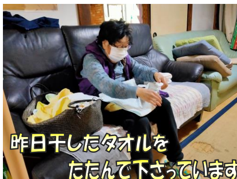
昨日干したタオルをたたんで下さっています