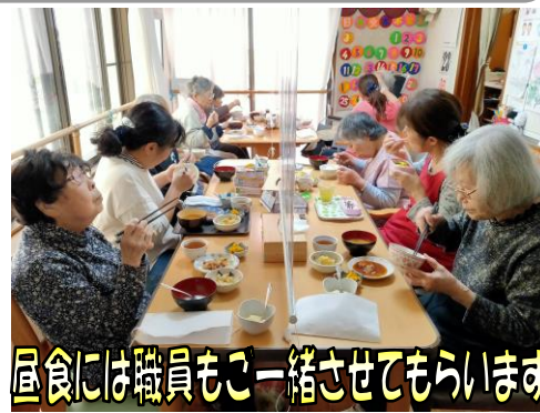
昼食には職員も一緒にさせていただきます