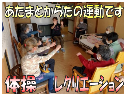
あたまとからだの運動です